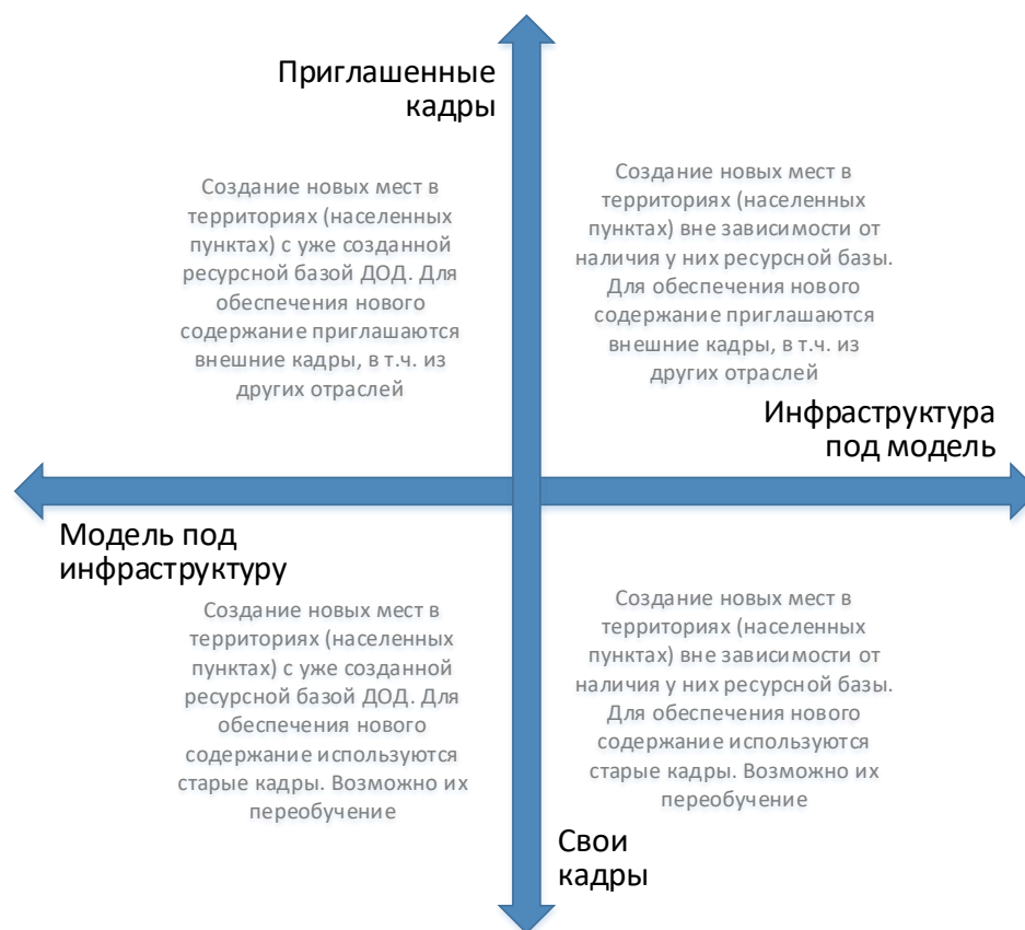
Рис. 6. Шкалы выбора модели инфраструктурного и кадрового обеспечения для типовой модели создания новых мест дополнительного образования

Следует отметить, что механизмы инфраструктурного и кадрового обеспечения не существуют в их полярных вариантах. Решения даже в рамках реализации одной модели будут различны. Анализ перечисленных выше характеристик позволяет сделать эти точечные решения более точными и эффективными.