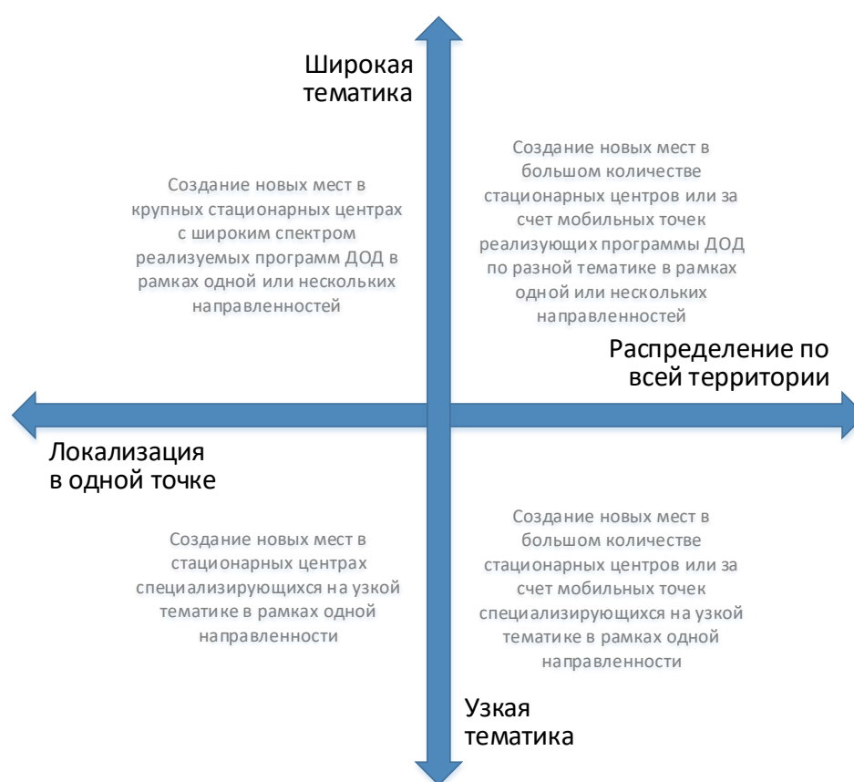
Рис. 3. Шкалы выбора масштаба и формы реализации новых мест по программам ДОД

При невыполнении хотя бы одного из них возникает необходимость пространственного распределения реализуемой модели через мобильные или сетевые решения.