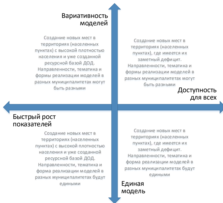
Рис. 4. Шкалы выбора модели создания новых мест с учетом актуальной управленческой политики