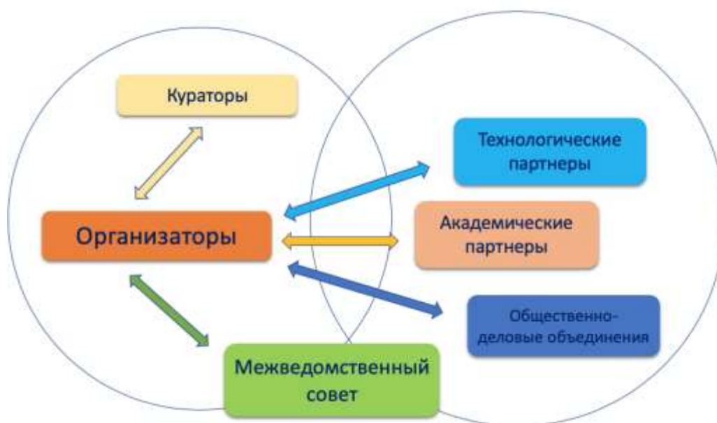
Рис. 1. Схема взаимодействия участников мероприятий по внедрению и функционированию типовой модели «Спортика»

Схема взаимодействия участников мероприятий по внедрению и функционированию типовой модели «Спортика» приведена на рис. 1.