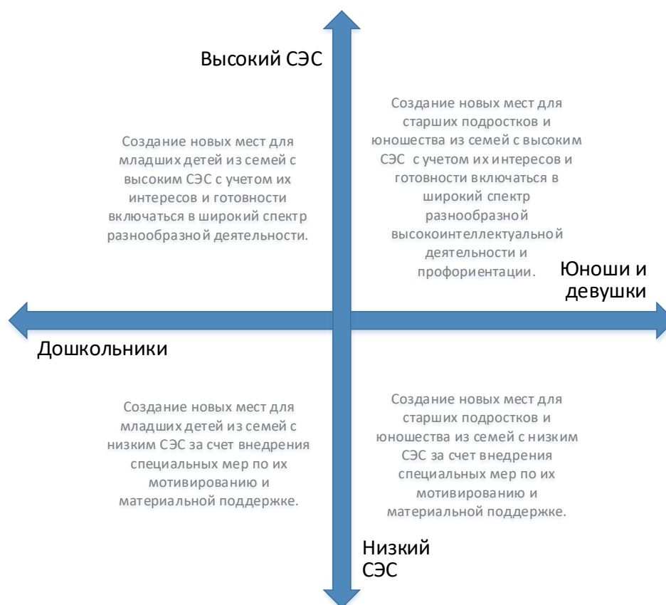
Рис. 5. Шкалы выбора модели создания новых мест по программам физкультурно-спортивной направленности с учетом особенностей контингента обучающихся

Вовлечение в программы детей из семей с низким образовательным и культурным уровнем потребует осуществления определенных PR-шагов, поиска мотиваторов для данных детей, в том числе материальных.