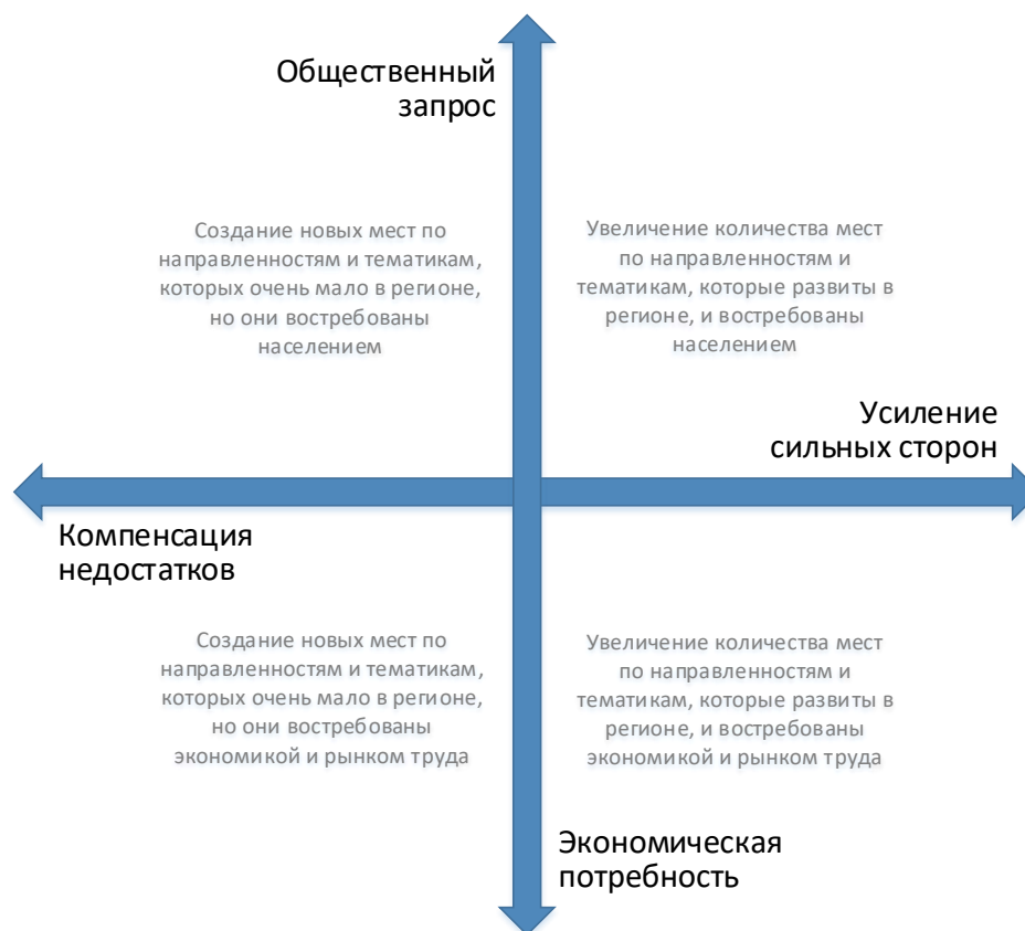
Рис. 2. Шкалы выбора тематики и тактики создания новых мест дополнительного образования